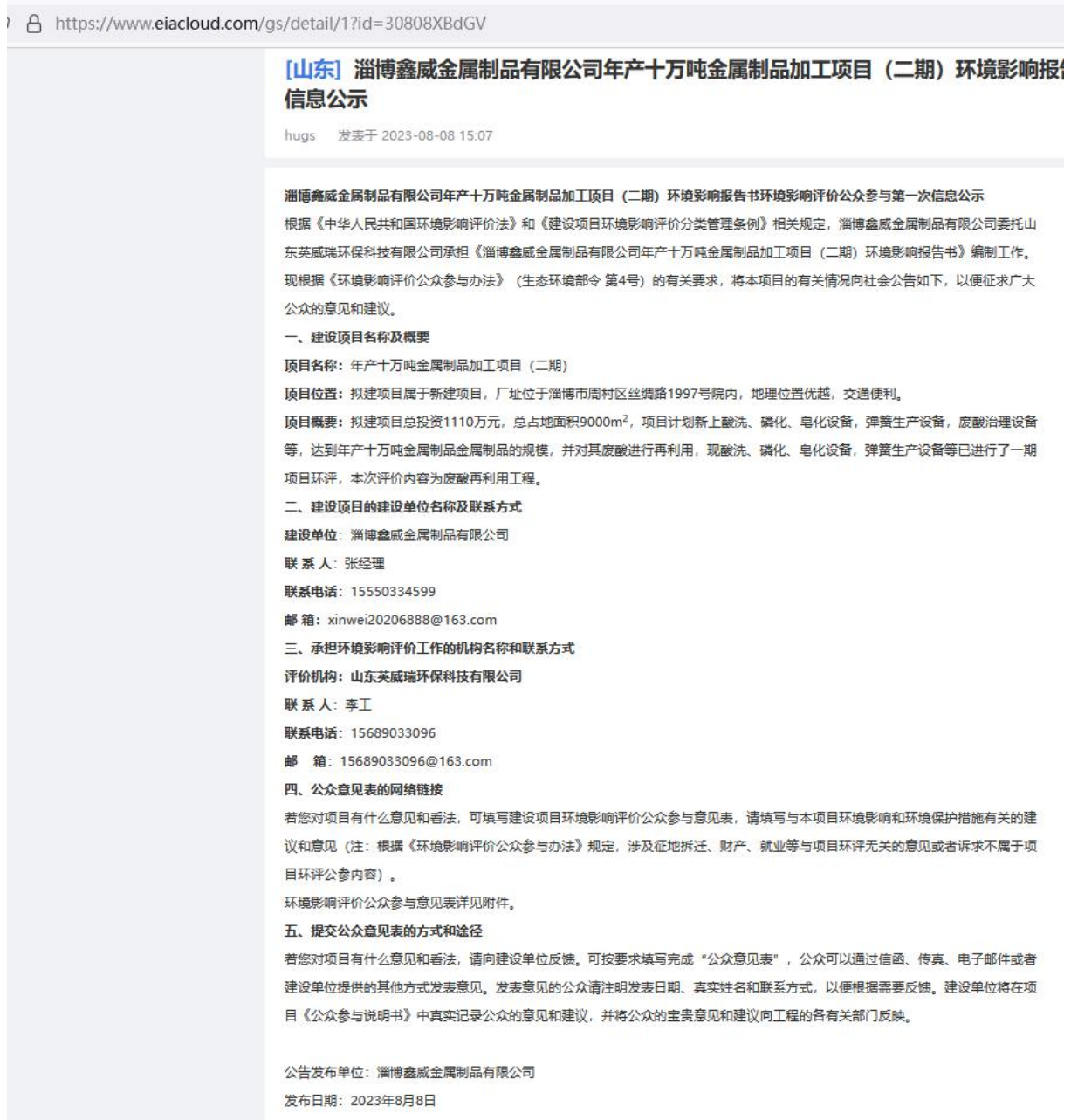
图2-1 环境影响评价首次公示截图